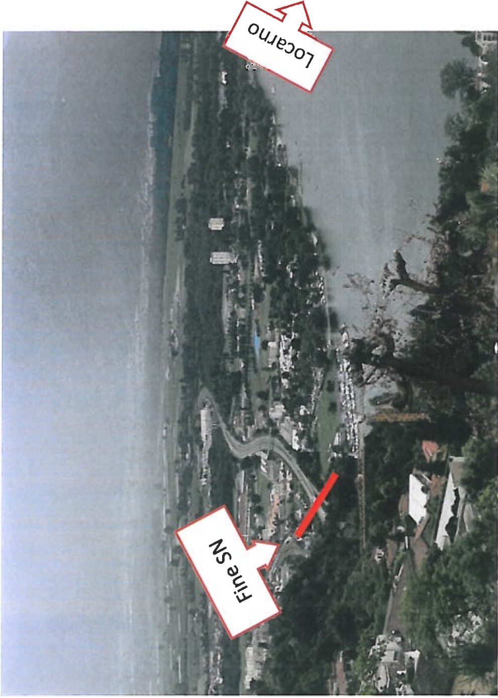
Fine della Strada Nazionale (SN) come proposto dal Messaggio