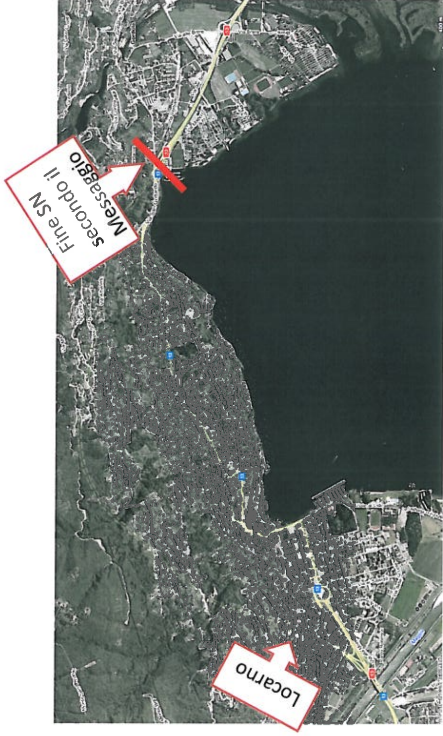
Tratta mancante della Strada Nazionale (SN)