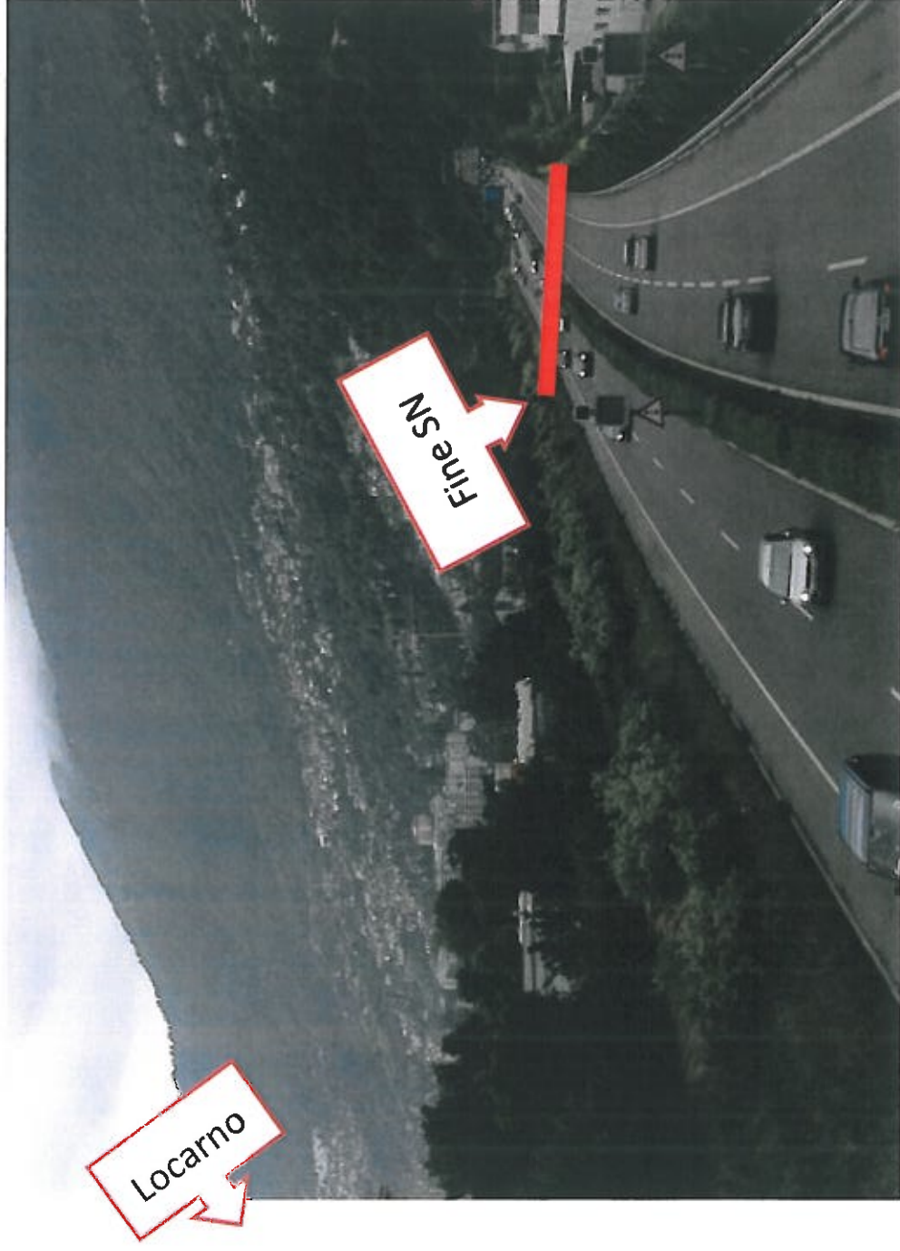
Fine della Strada Nazionale (SN) come proposto dal Messaggio