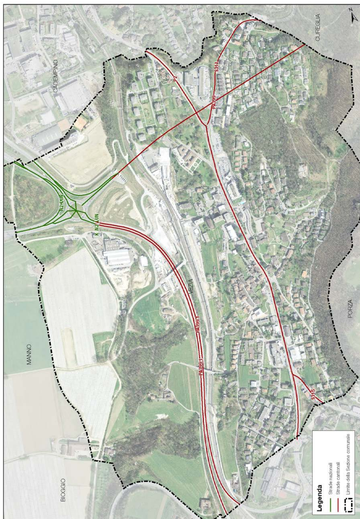
Fig. 1 – Mappa delle strade considerate nel catasto del rumore