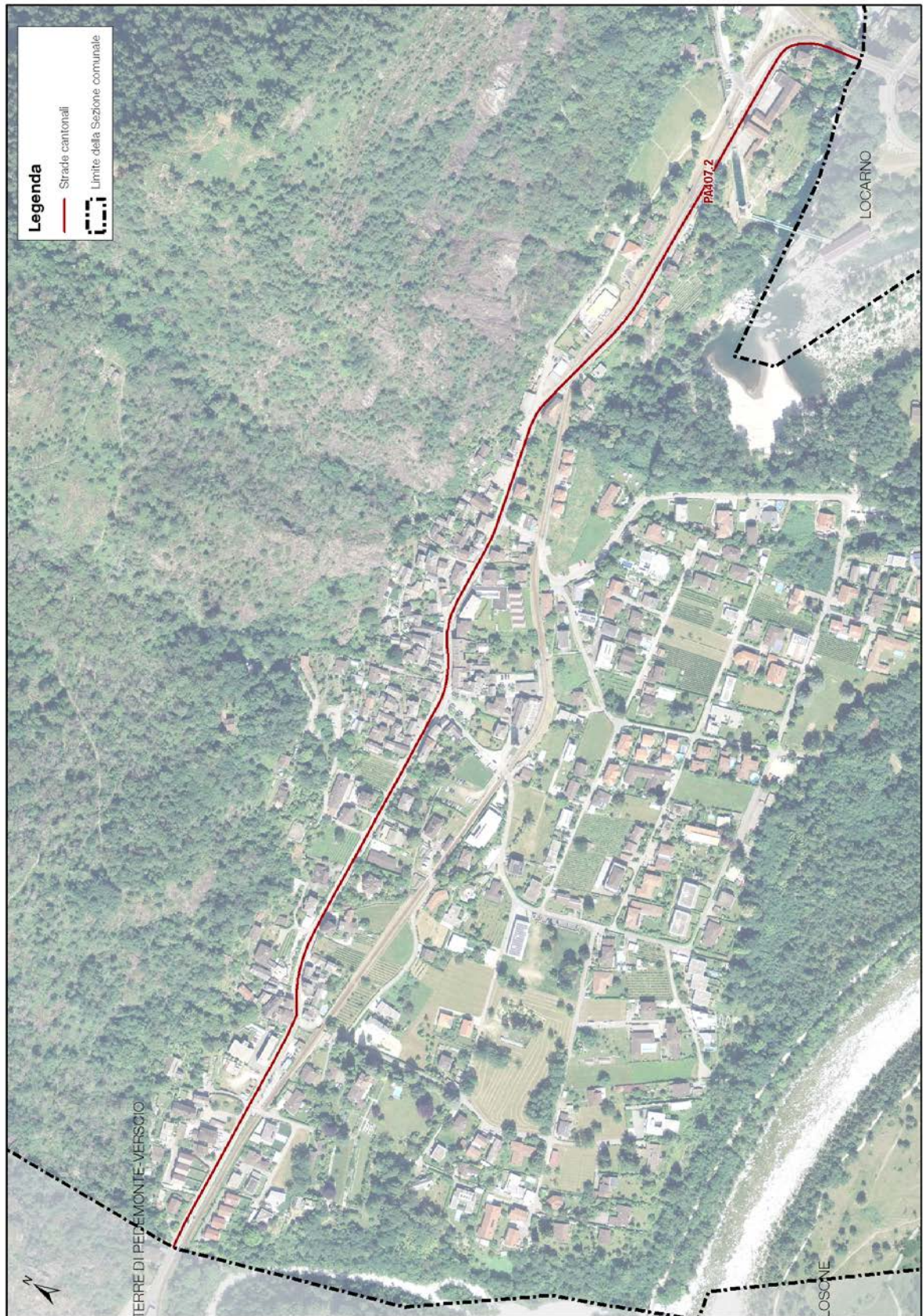
Fig. 1 – Mappa delle strade considerate nel catasto del rumore