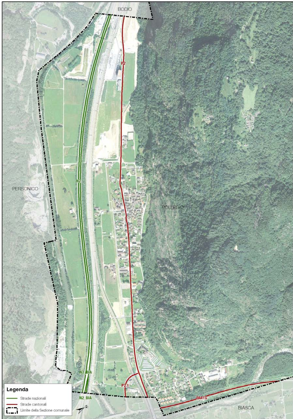
Fig. 1 – Mappa delle strade considerate nel catasto del rumore