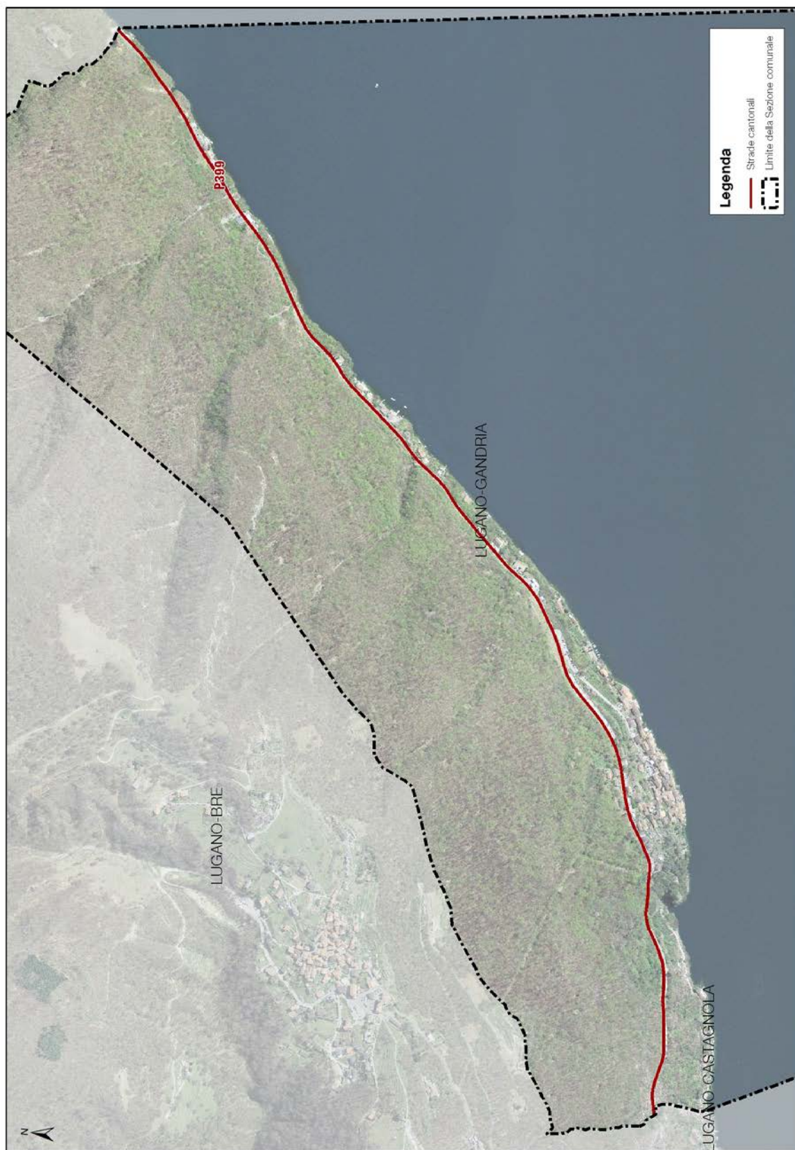
Fig. 1 – Mappa delle strade considerate nel catasto del rumore