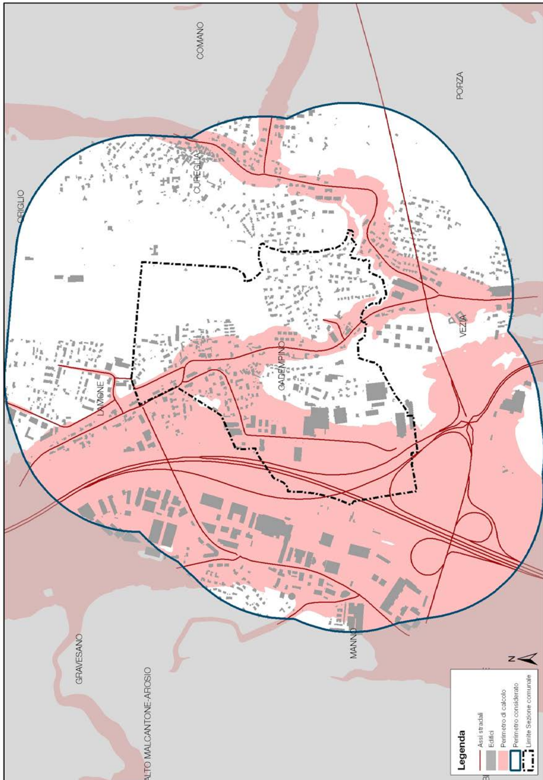
Fig. 2 – Perimetro di calcolo: strade e edifici che rientrano nelle zone soggette a valori d'immissione superiori ai 60 dB(A) giorno/50dB(A) notte riferite alla situazione attuale 2016