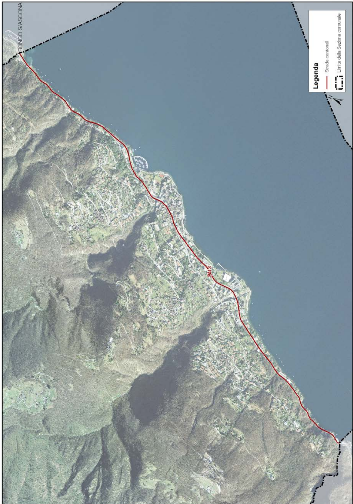
Fig. 1 – Mappa delle strade considerate nel catasto del rumore