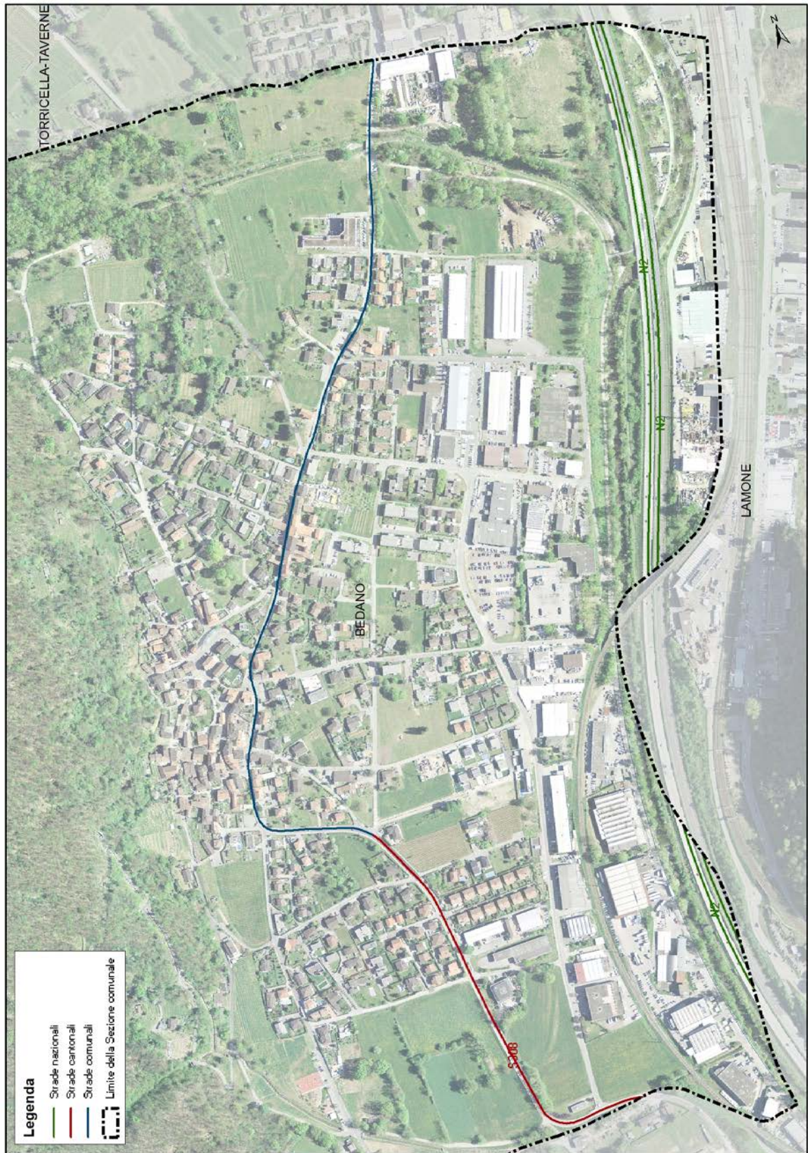
Fig. 1 – Mappa delle strade considerate nel catasto del rumore