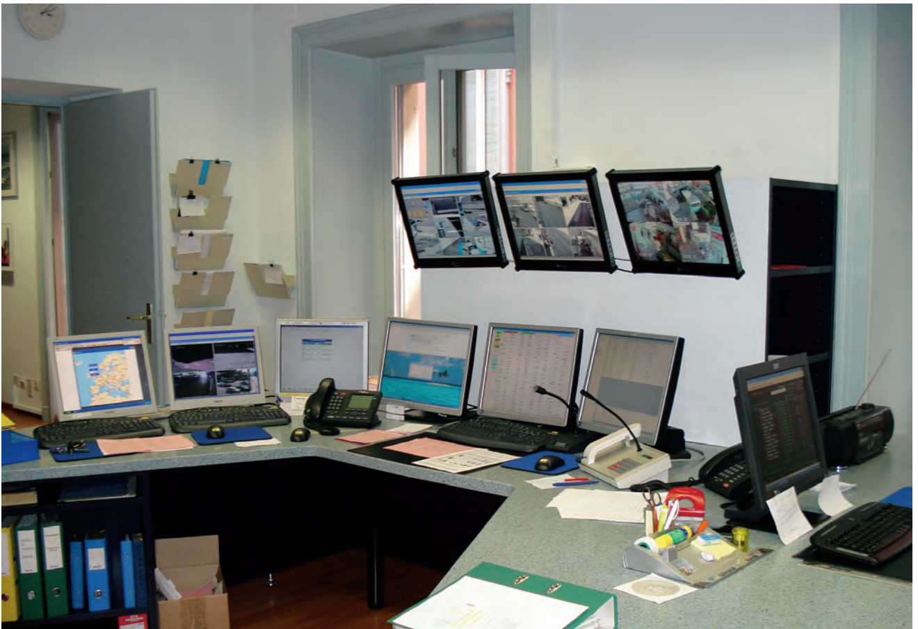
Fig. 3 – Centrale operativa della TPL in via Carducci a Lugano