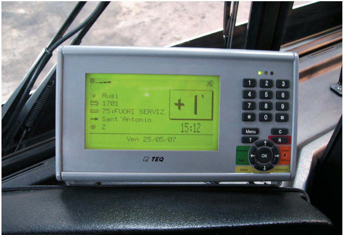
Fig. 2 – Computer di bordo in dotazione alla TPL