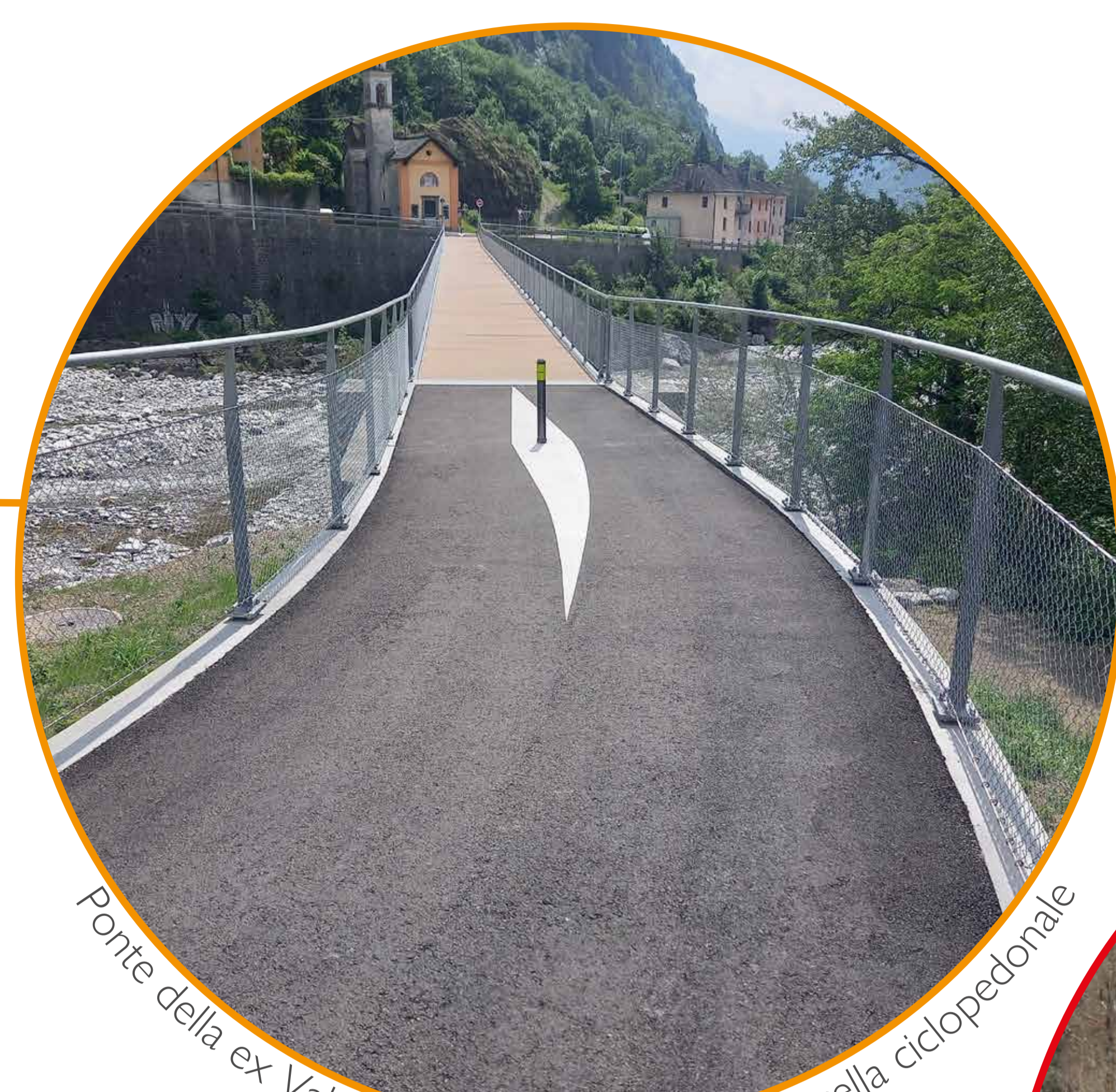
Ponte della ex Valmaggina convertito in passerella ciclopedonale