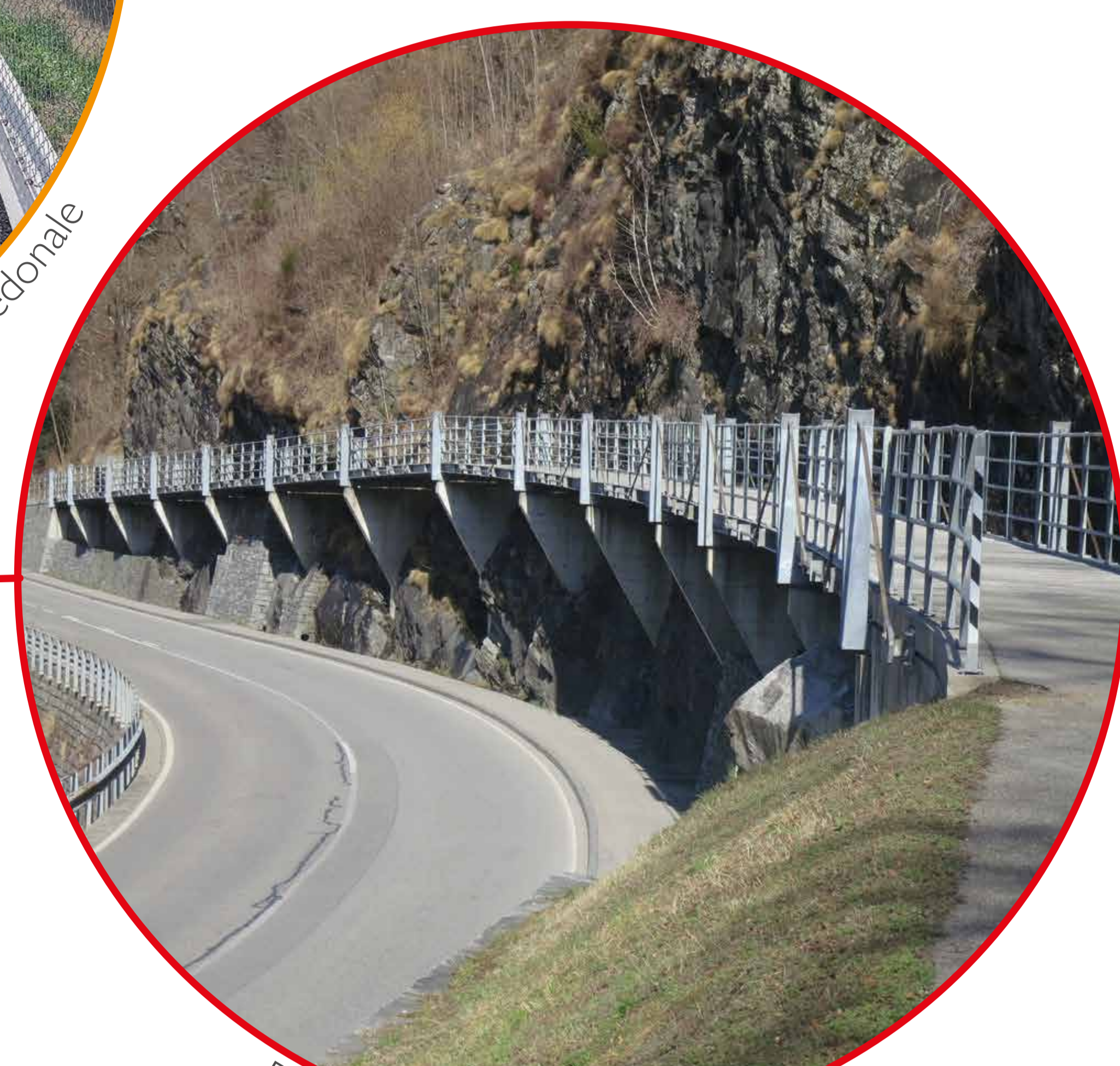
Pista sul vecchio tracciato ferroviario