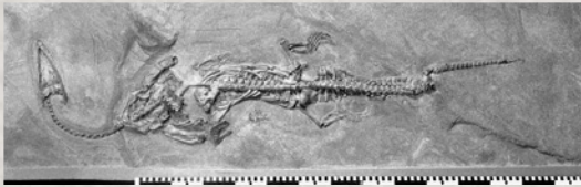
" Ceresiosaurus " lanzi , Cassina 1933.