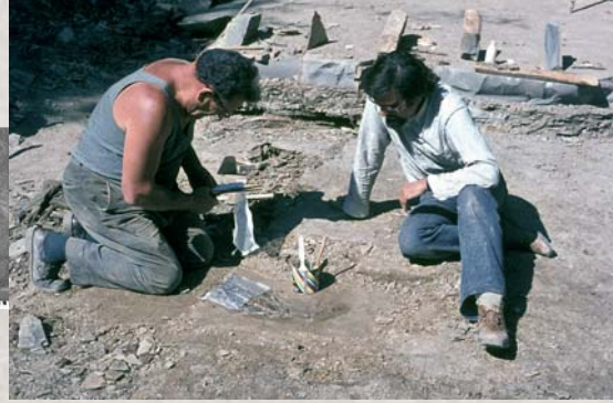
Neusticosaurus edwardsii . Il fossile viene consolidato per consentirne l'estrazione. Cassina, campagna 1971-1975.