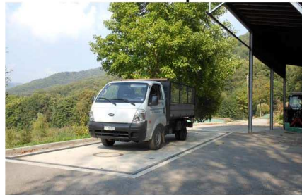
5 - Veicolo in pesa