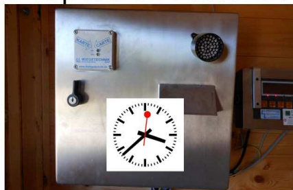
8 Aspettare 10 secondi!