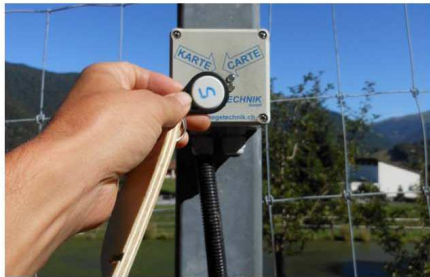
1 - Apertura barriera