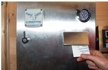
7 - Rilascio bollettino