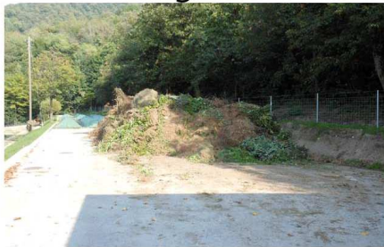
4 - Consegna scarti