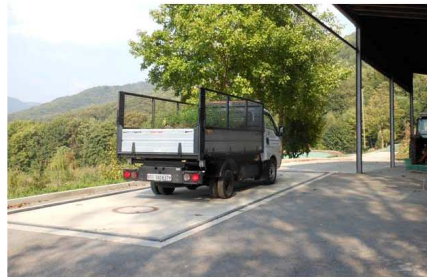
2 - Veicolo in pesa