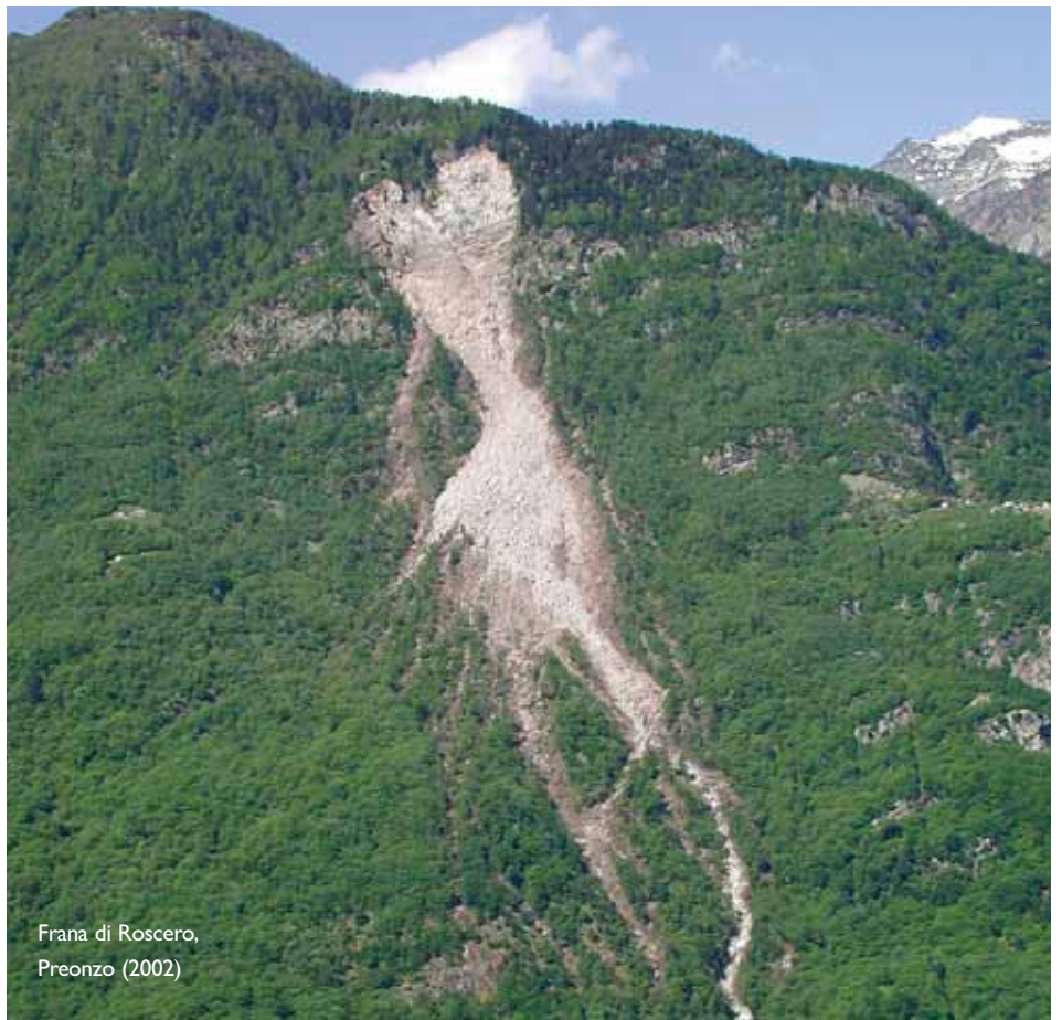
Frana di Roscero, Preonzo (2002)