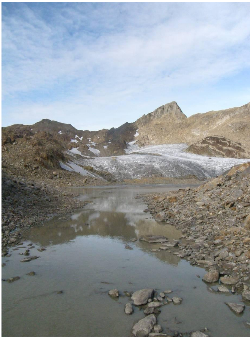
Bellinzona, maggio 2011