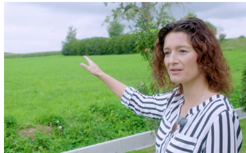
Protezione ad oggetto

Casa di appartamenti a Locarno, Cantone Ticino