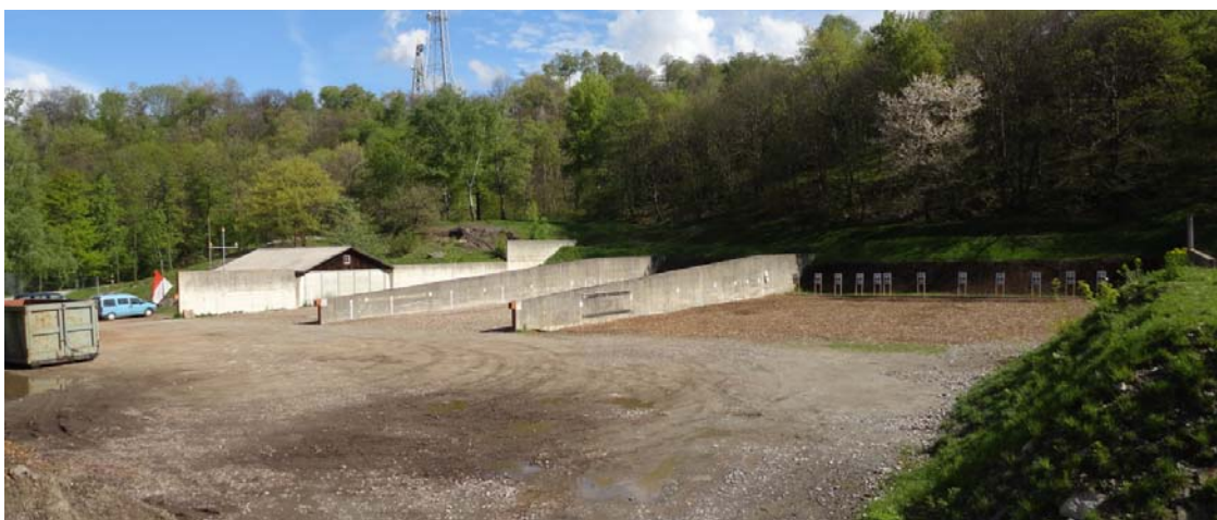
“Impianti di tiro esistenti”

Nella parte più alta dell'area vi sono poligoni per il tiro a corta distanza, visibili nella foto sovrastante.