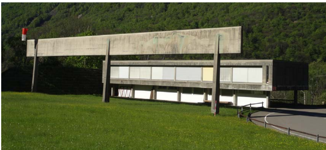
“Casa del tiratore”