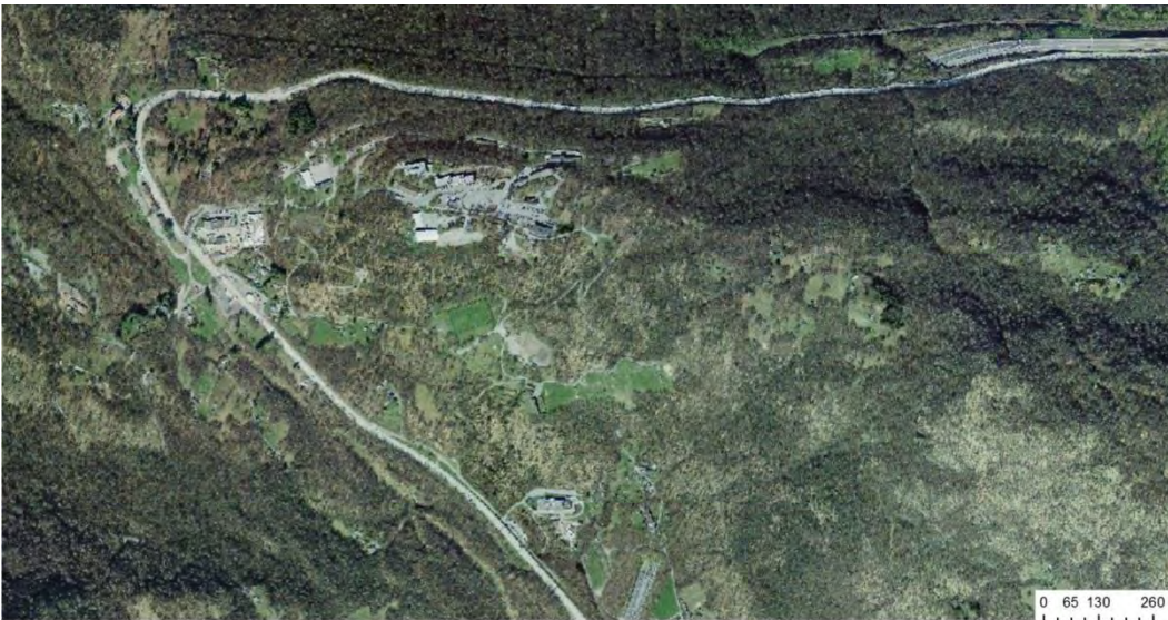
Figura 5. Foto area del 2016.