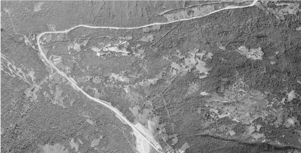
Figura 4. Foto area del 1971.

A livello locale si può tuttavia osservare come la superficie forestale del comprensorio Monte Ceneri/Piazza d'armi sia aumentata a partire dagli anni '40, come testimoniano le fotografie aeree sottostanti (cfr. Figura 4 e Figura 5).