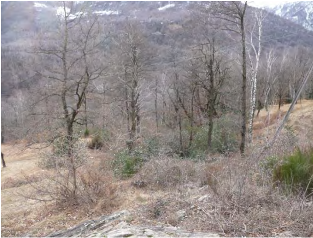
Figura 2. Bosco interessato dal dissodamento vicino ai parcheggi in progetto (foto del 06.02.2017).

Il bosco interessato dal dissodamento è composto da castagno, rovere, betulla e qualche ciliegio. La tipologia forestale determinata è 42C Castagneto oligotrofo ( Phyteumo betonicifolae-Quercetum castanetosum , cfr. Figura 2 e Figura 3).