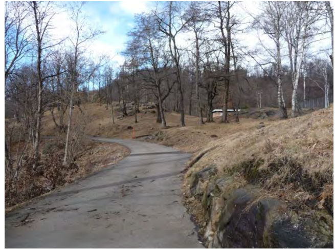
Figura 3. Bosco interessato dal dissodamento lungo la strada d'accesso (foto del 06.02.2017).