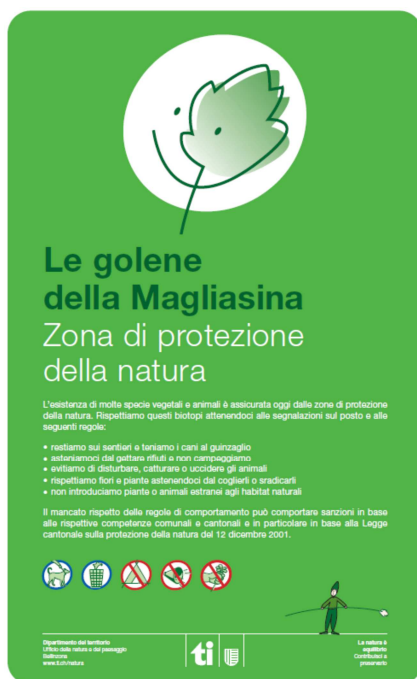
Figura 97: il concetto grafico del cartello

Sono stati posati presso i principali accessi alla zona protetta 6 cartelli informativi.