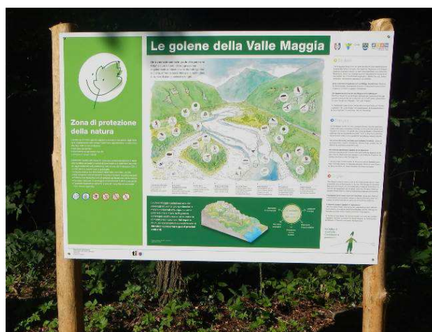
Figure 99 e 100: pannello didattico posato presso le scuole elementari dei Ronchini di Aurigeno (sinistra) e cartello divulgativo posato a Someo (destra).