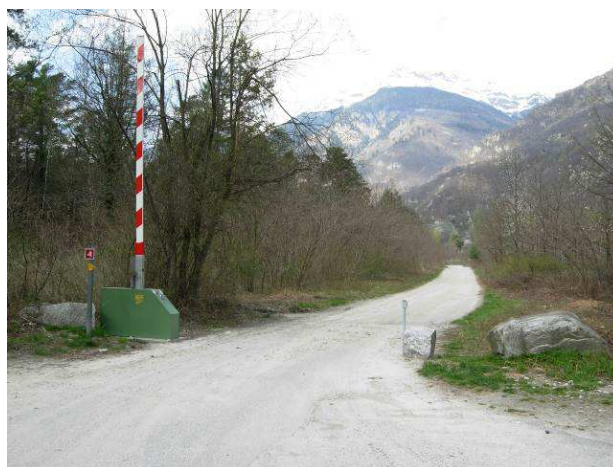
Figure 101 e 102: una delle barriere danneggiate (sinistra) e riparate (destra)