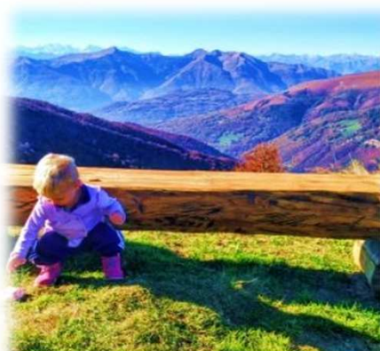
Garga 🏆 1° posto

Lo fa una bimba di 1 anno, forza ce la puoi fare anche tu!