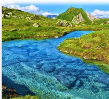
Felina Photography 🏆 2° posto

Acque pulitissime al Campolungo, Ticino, Svizzera