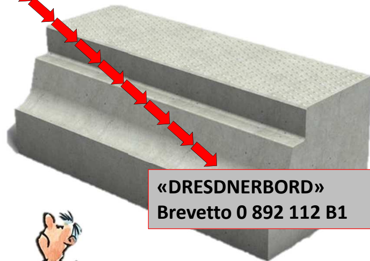
«DRESDNERBORD» Brevetto 0 892 112 B1