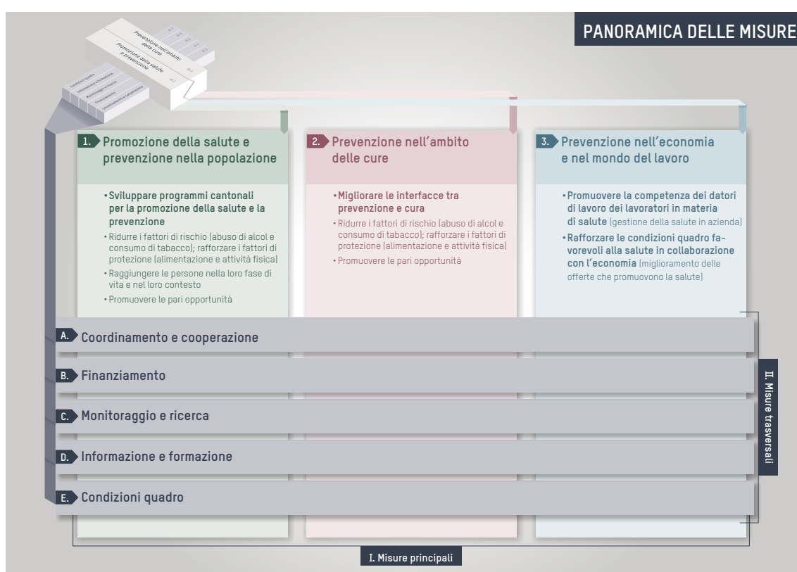
Figura 2: Piano di misure MNT 2021-2024

La strategia MNT definisce due aree d'intervento (AI), che sono sostenute da cinque misure trasversali: Promozione della salute e prevenzione (AI 1) Prevenzione nell'ambito delle cure (AI 2). Il relativo piano di misure MNT ( figura 2 ) definisce le misure necessarie per migliorare il coordinamento tra gli attori, aumentare l'efficienza della prevenzione e della promozione della salute e raggiungere gli obiettivi della strategia MNT.