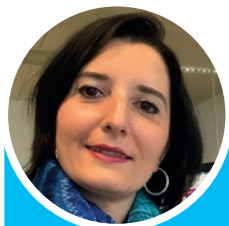
Autrice: Alessandra Spitale Responsabile Centro Programma Screening Ticino

Cos'è, a cosa serve e com'è organizzato?