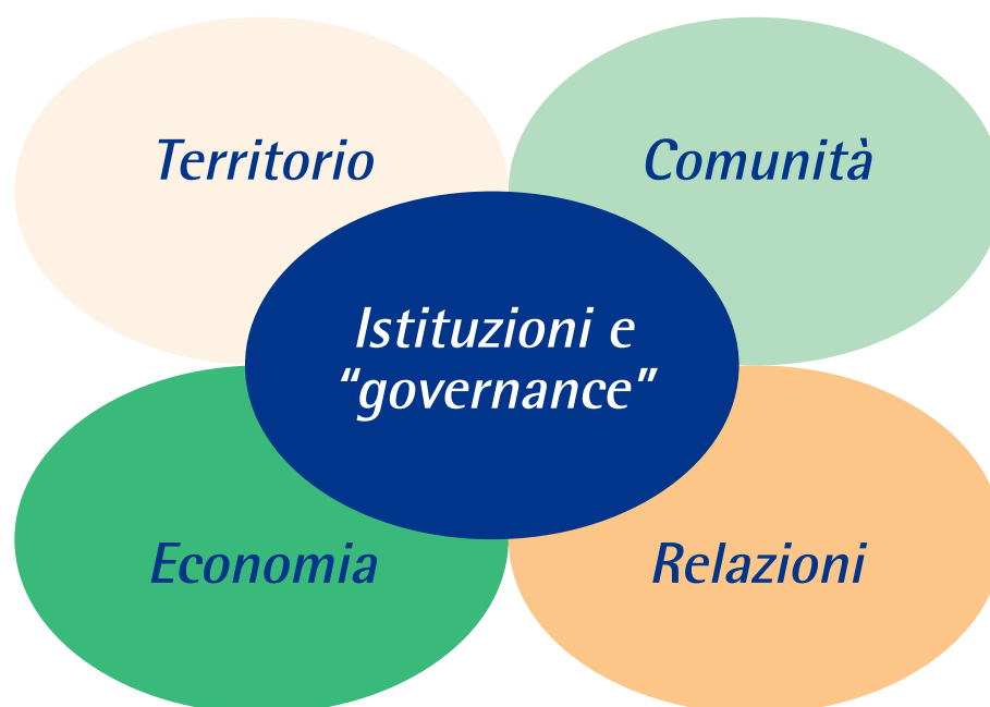
Figura 1: le componenti di un sistema territoriale

In questo contesto, le istituzioni devono assicurare non solo il «governo» ma soprattutto la «governance» cioè la capacità di fare interagire tra di loro la società e l'economia (nel rispetto del territorio), di interessare relazioni (e interazioni) con altri territori. Alle istituzioni si chiede la capacità di condurre trattative (invece di combattere), di cooperare (invece di contrapporsi) di realizzare e gestire collaborazioni anche con i privati.