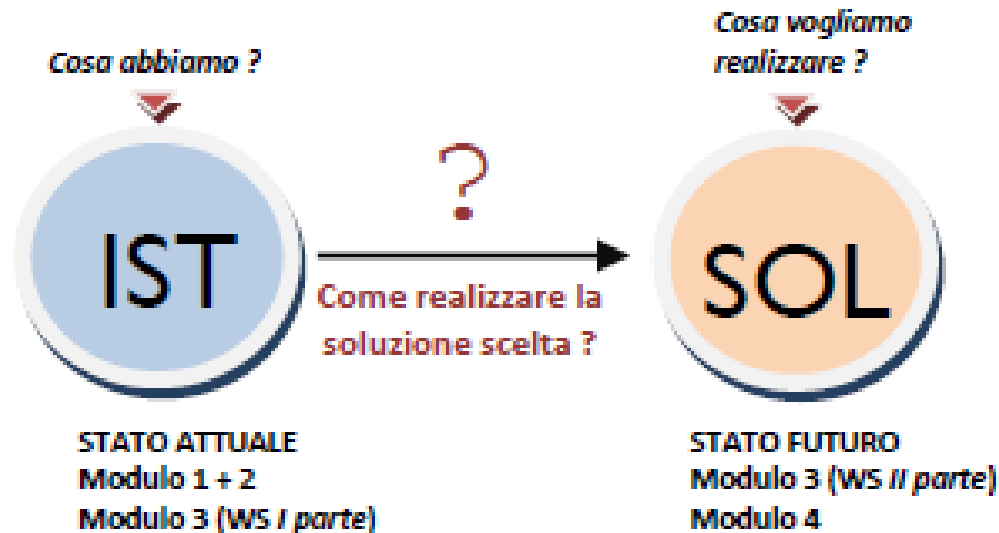
Figura 1 L'approccio strategico