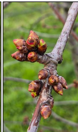
Ciliegio Regina, Mezzana, 18.03.2024, Stadio B , rigonfiamento gemme