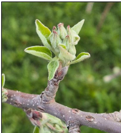
Melo Breaburn, Mezzana, 18.03.2024, Stadio D , bottoni verdi