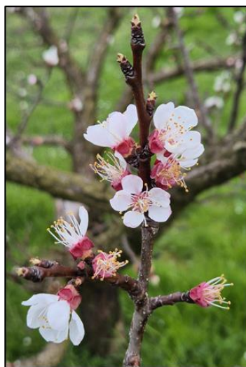
Albicocco Luiset, S. Antonino, 18.03.2024, Stadio G , inizio caduta petali