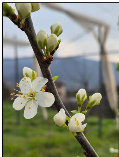
Prugno Cacaks, Mezzana, 18.03.2024, Stadio E-F , inizio fioritura