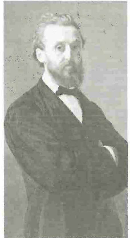
Antonio Ciseri, autoritratto.

Questa mansione viene svolta da lui con grande impegno: d'ora innanzi tornerà nel Ticino ogni anno a fine luglio e spesso in settembre o in maggio,