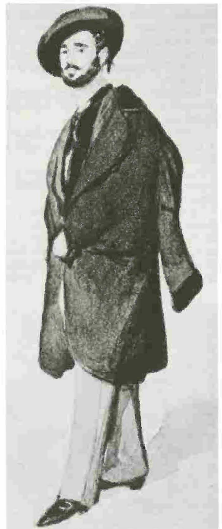
Carlo Bossoli, autoritratto.