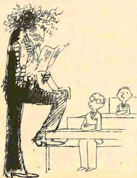
Da: Le nouvel observateur.

Sviluppare lo spirito critico e l'immaginazione degli allievi è il compito ritenuto più importante dalla maggioranza degli insegnanti. Per i docenti aventi meno di 30 anni, la «cultura generale» tradizionale è relegata all'ultimo posto.