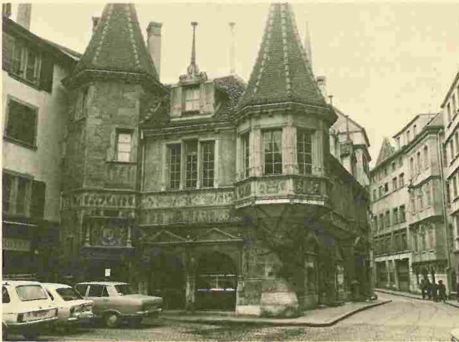
Neuchâtel, «La maison des Halles» - L'edificio, più volte rimaneggiato e restaurato, risale al 1575, opera di Laurent Perroud, commissionata dal principe Léonor d'Orléans - Longueville: era adibito nel piano di terra alla vendita dei grani e al primo piano ai «marchands drapiers» nei giorni di fiera. La facciata meridionale ricca di decorazioni a foglie, a fiori, a putti, presenta due torrette: a sinistra quella detta «de l'escalier», esagonale, con lo stemma del principe sopra la porta; a destra la torretta d'angolo arditamente aggettante a mo' di «Erker».

A Bettingen , si sta studiando il progetto per il restauro della Chrischonakirche , oratorio dell'inizio del secolo XVI situato sul pendio del Dinkelberg .