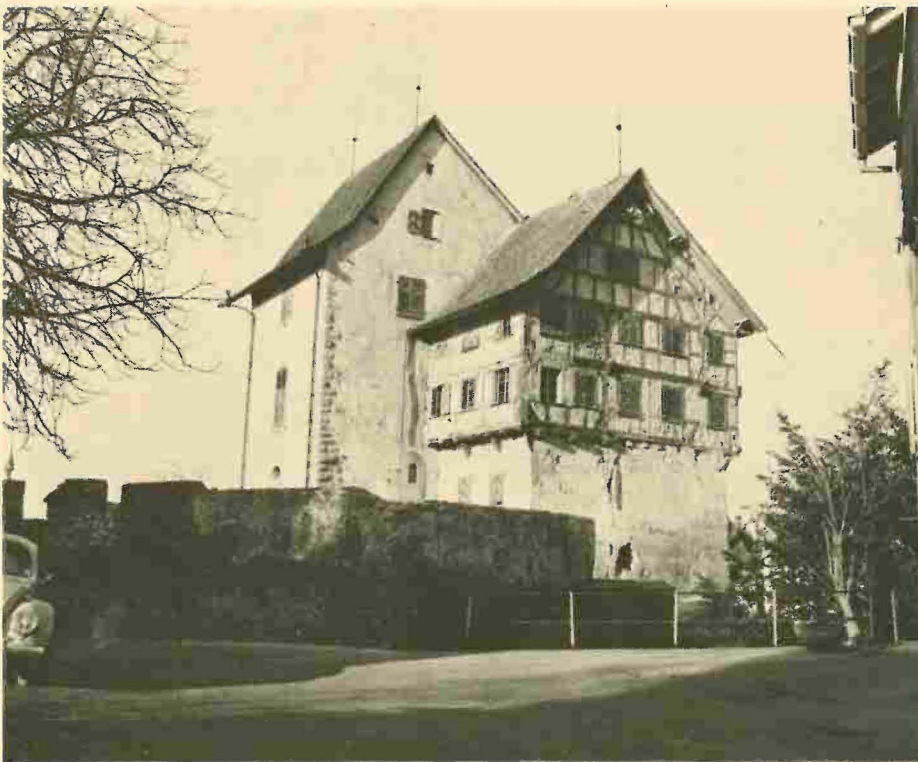
Zugo - Il «Burg» di Zugo, costruzione già nota nel tempo degli Alemanni, sede poi (modificata) dei Lenzburgo e dei Kiburgo, ricco di storia pur nei secoli successivi, di vivace impianto tra il militaresco e il borghese, ora in via di restauro, e destinato a diventare museo storico del Cantone.

ottenuto il consenso. Eccole: restituzione alla città di Soletta dello Schützenhaus appartenente in origine alla Società costituita nel 1462 e a più riprese manomesso perfino per adibirlo a fabbrica; acquisto da parte della città di una delle tre residenze estive ( Ischenhof ), nei dintorni di Soletta , risalente al 1678; impedire la demolizione del ristorante Bad che fu uno dei rinomati Fressbädli al tempo di Biedermeier (luoghi d'incontri per manifestazioni politiche, culturali, teatrali ecc.); evitare la demolizione di una casa rurale del XIX secolo decisa dal comune di Matzendorf ; salvaguardia dell'albergo Zur Krone (1700) di Oltan ; salvaguardia del nucleo antico del villaggio di Seewen minacciato dalla costruzione di