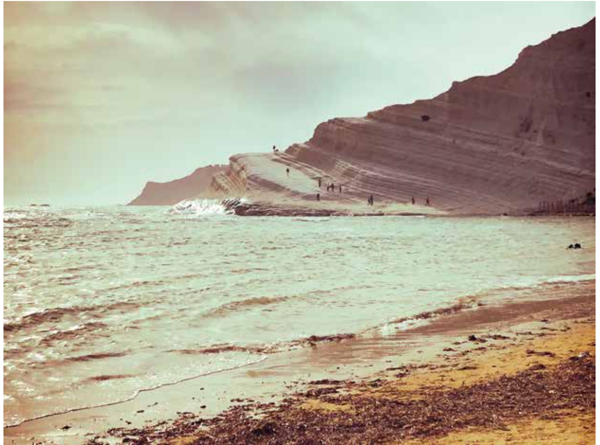
Gianluca Rainone 3° anno di grafica – CSIA