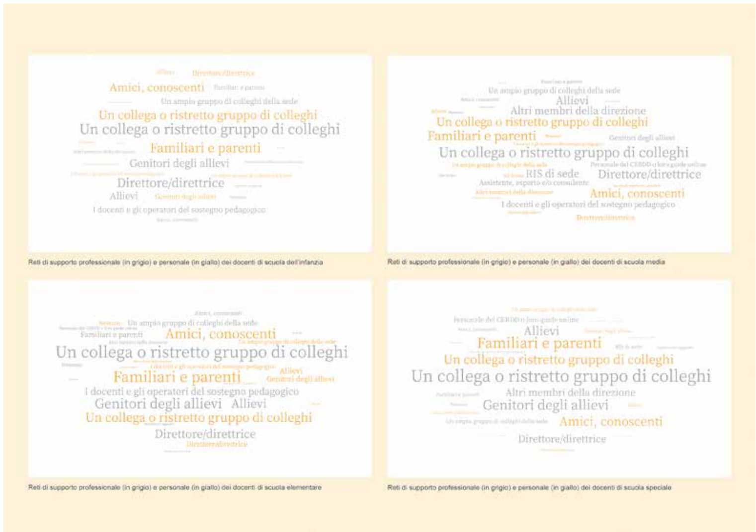
Figura 3 – Le reti personali e professionali di vicinanza.

i figli sono apparsi sereni e felici durante la scuola a distanza, ma otto allievi delle scuole comunali su dieci hanno sentito la mancanza dei compagni di scuola e sette su dieci quella dei docenti. Stare a casa è piaciuto agli allievi (il 30% ha risposto “sì”, il 53% ha risposto “a volte”), ma molti di loro si sono anche annoiati (16% “sì” e 59% “a volte”). La Figura 2 illustra il vissuto degli allievi durante la scuola a distanza e parzialmente in presenza.