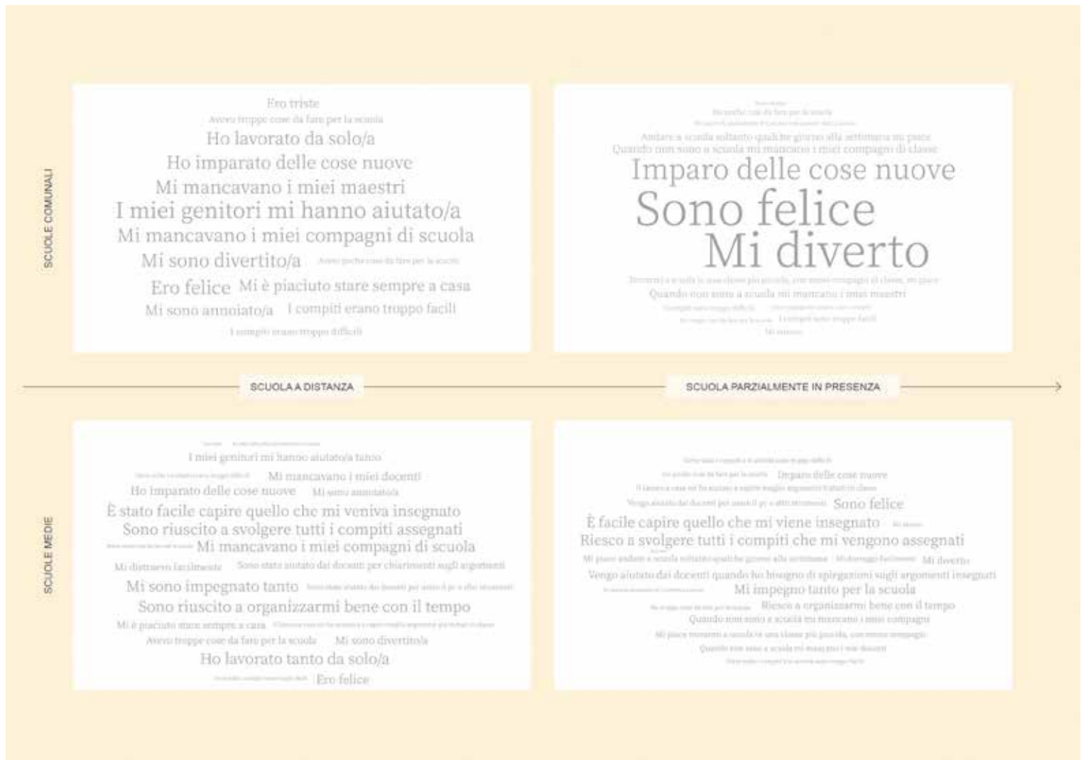
Figura 2 – Vissuto degli allievi durante la scuola a distanza e parzialmente in presenza.

gli allievi abbiano potuto apprendere adeguatamente durante questo periodo.