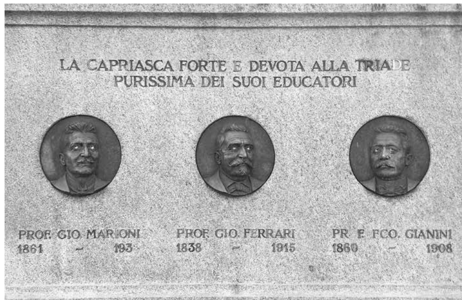
Lapide ubicata sulla facciata del Municipio di Capriasca

In altra lettera della stessa data all'ispettore scolastico Giovanni Marioni, Jäggi accusava ricevuta della spedizione "dei libri e manoscritti di proprietà del compianto prof. Gianini". L'elenco comprendeva una trentina tra libri, opuscoli e manoscritti di cui Gianini era l'autore, nonché due testi ed una fotografia del defunto direttore della Scuola normale maschile, il teologo Luigi Imperatori. Tra i testi di Imperatori vi era pure la "Commemorazione di Enrico Pestalozzi", pubblicata nel 1896, che costituisce un documento molto importante per la ricostruzione della storia della pedagogia in Ticino e in particolare della storia degli insegnamenti pedagogici alla Scuola normale.