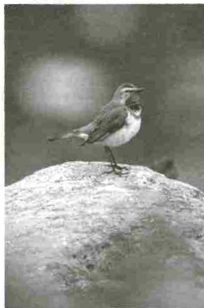
Il Pettazzurro, uccello alpino molto raro.

Il SSE intende collegare offerte di informazione esistenti, raccogliere