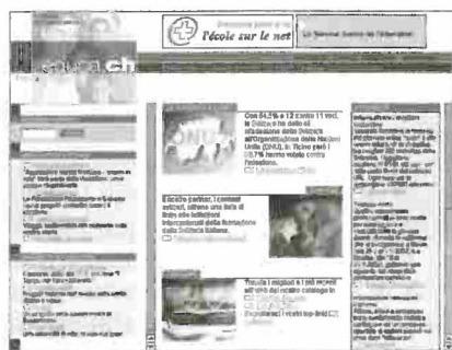
Prima pagina delle tre redazioni linguistiche

Dalla pagina del portale, che presenta tre link per la scelta della lingua (italiano, francese, tedesco), si giunge sulla homepage della redazione linguistica desiderata.