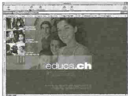
La Homepage SSE

Dalla pagina del portale, che presenta tre link per la scelta della lingua (italiano, francese, tedesco), si giunge sulla homepage della redazione linguistica desiderata.