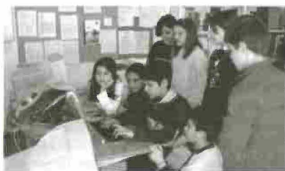
La prima pagina del sito «Scuoladic».

Nel mese di gennaio dello scorso anno la Divisione della scuola del DIC annunciava l'apertura di un nuovo sito internet - www.scuoladic.ti.ch - rivolto ai docenti, ma anche agli allievi delle scuole ticinesi e ai loro genitori. L'intenzione principale era quella di diffondere le informazioni concernenti i servizi e le attività esistenti nell'ambito del sistema scolastico cantonale, con particolare attenzione alla scuola dell'obbligo.