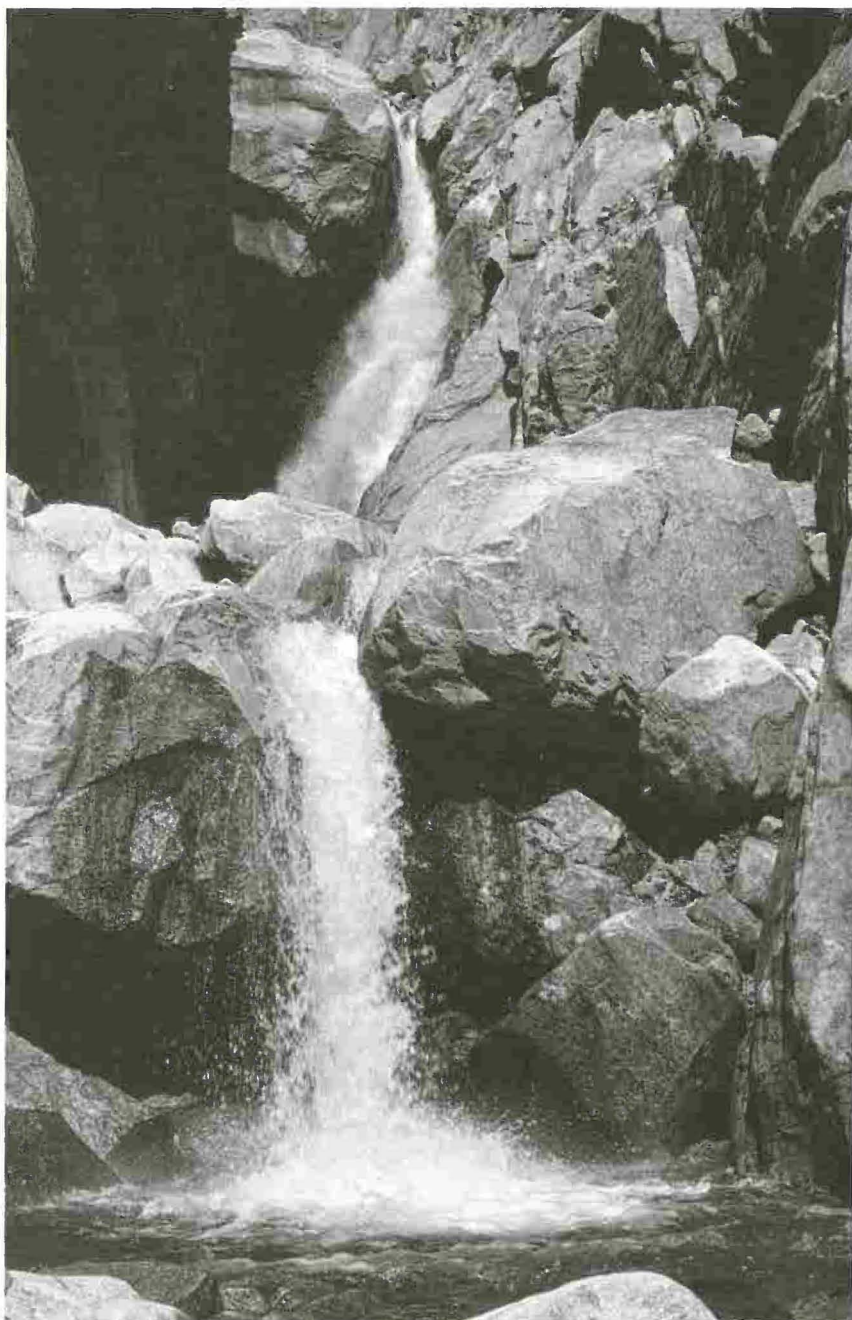
Il Vallone di Foidi. Tratta dal libro «Valle Bavona, terra e montagne d'incanto», di Aldo Cattaneo, SalvioniEdizioni.