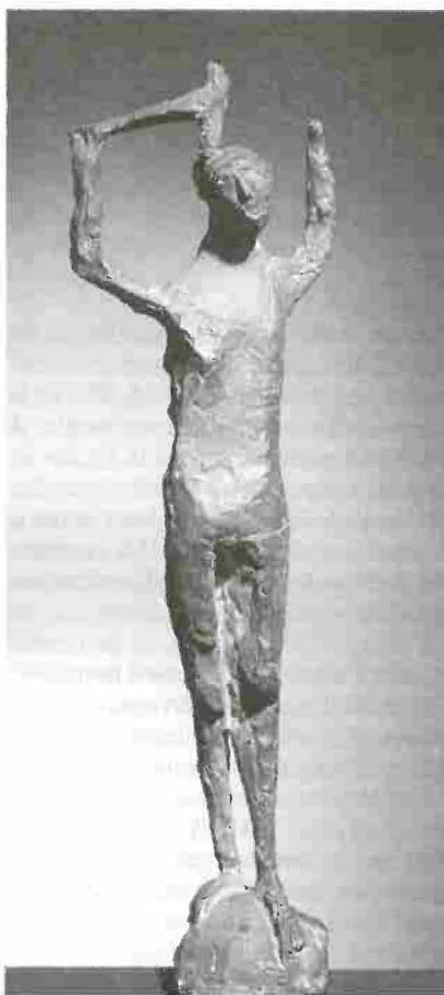
Marino Marini, Piccolo giocoliere , 1953, Bronzo

Pensando invece alla cooperazione per lo sviluppo, una fetta consistente di adolescenti reputa che la misura meglio attuabile sia quella di formare il personale indigeno dei paesi in via di sviluppo con l'ausilio di esperti stranieri, in modo che questo personale possa in seguito dirigere autonomamente i progetti di sviluppo (42,5%); infatti solo il 32,9% ritiene che i paesi