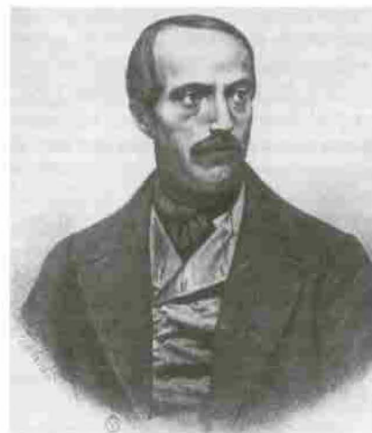
Giuseppe Mazzini (1805-1872) verso il 1830.