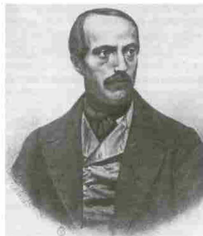
Giuseppe Mazzini (1805-1872) verso il 1830.