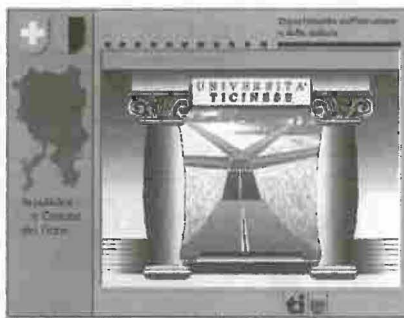
Applicazione multimediale su computer, realizzata da ProMedia di Armando Boneffe e Javier Martinez.

trale l'entusiasmo e la collaborazione di tante forze, istituzionali o spontanee.