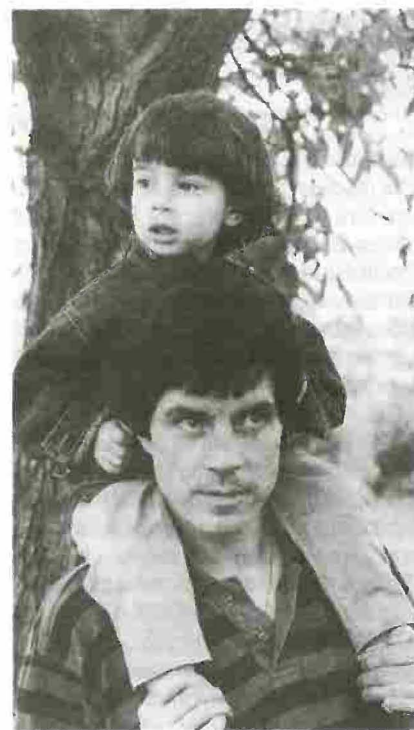
Da: Scuola Materna, 1994, N. 12

Infine, dal profilo della portata prati-