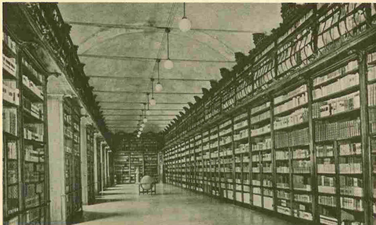
Il salone antico della Biblioteca Universitaria

La consapevolezza e la responsabilità degli ispettori e dei direttori costituiscono, d'altra parte, la migliore contropartita all'iniziativa del governo ticinese che — come ha ribadito l'on. Sadis nel suo intervento a Pavia — è particolarmente interessato «ad assicurare solidità ed efficienza alla scuola dell'obbligo, che è la scuola di tutti e che è sempre stata particolarmente presente nelle preoccupazioni quotidiane del nostro stato nella sua tradizione di democrazia».