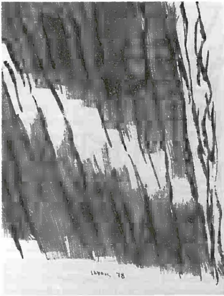
Massimo Cavalli - «Contrasto», 1978, acquaforte su rame, cm 50x40

Per questi motivi si sono moltiplicati gli studi e le ricerche per individuare e valutare i meccanismi che l'istituzione mette in atto e che incidono sul passaggio. Numerose sono le cause ritenute responsabili e che rendono particolarmente difficoltosa una effettiva armonizzazione; pensiamo unicamente alla diversa organizzazione sul piano amministrativo che caratterizza i vari settori scolastici, alla formazione e allo statuto degli insegnanti, alla peculiarità delle finalità educative e alla conseguente impostazione pedagogico-didattica spesso soggetta a profondi mutamenti da un ordine di scuola all'altro.