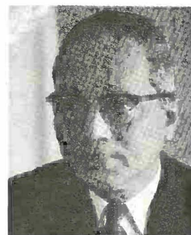
1961-1971 U Thant