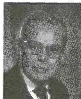
Dal 1982 Javier Pérez de Cuéllar