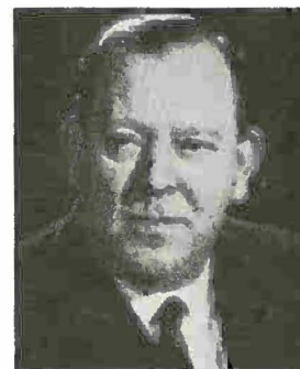
1946-1953 Trygve Lie

Sia che la Svizzera aderisca, sia che non aderisca all'ONU, le «porte aperte» del Palazzo di Ginevra sono un'occasione da non lasciarsi sfuggire dai docenti che vogliono favorire per i loro allievi una migliore comprensione del compito, degli scopi, della struttura e delle attività dell'ONU, nella sede stessa dove vengono dibattuti i grandi problemi del nostro tempo.