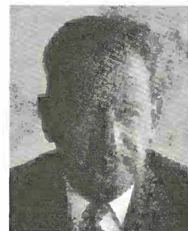
1953-1961 Dag Hammarskjöld