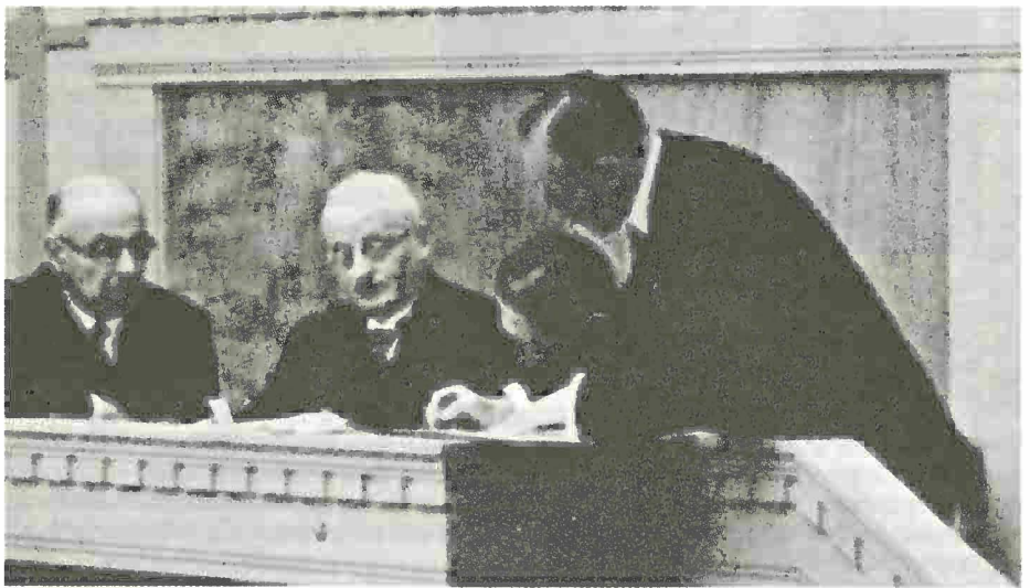
1935. Giuseppe Motta (al centro) è presidente della Società delle Nazioni.

Il cardine dei rapporti della Società verso gli stati membri era costituito, da un lato, da una serie di principi programmatici ed imprecisi e, dall'altro, da obblighi concreti, concernenti il mantenimento della pace e della sicurezza. L'articolo 8 stabiliva l'obbligo della limitazione degli armamenti; l'articolo 10 la garanzia dell'integrità territoriale e dell'autonomia politica; gli articoli 12 e 13