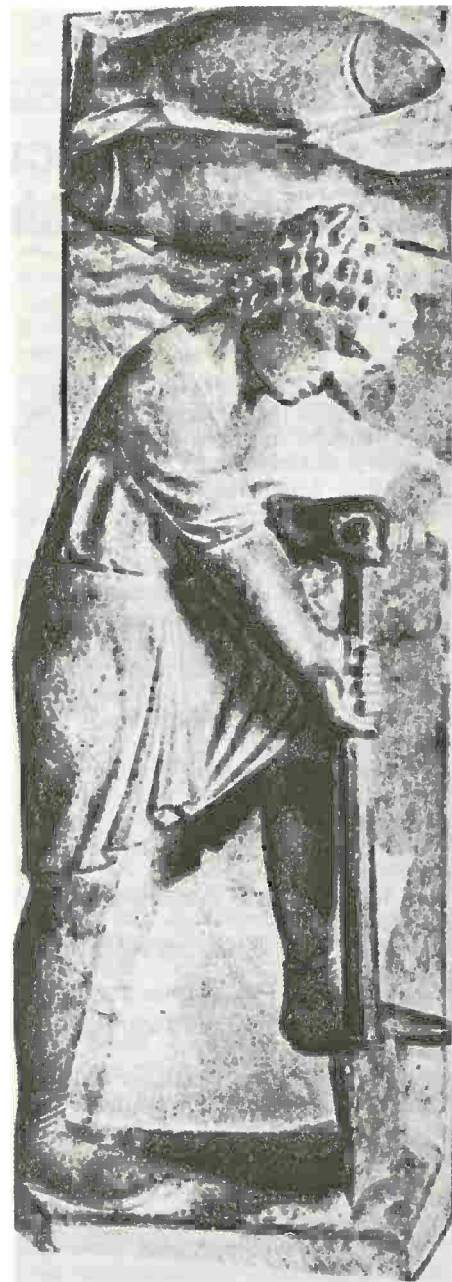
Battistero di Parma - Particolare del bassorilievo di Benedetto Antelami (1150-1233), scultore campionesse.

Questi esempi dimostrano come il sostegno pedagogico non può diventare un'istituzione che accoglie i ragazzi difficili o deboli per un certo tempo — una o due ore settimanali — per cercare di colmare le lacune scolastiche, per calmare definitivamente i disturbatori o per accelerare il ritmo dello sviluppo intellettuale. L'intervento individuale, pur essendo molto importante, è insufficiente, perché crea delle condizioni relazionali e di apprendimento particolari che non possono essere riprodotte automaticamente in classe, con altri docenti, se non vengono costruite le condizioni relazionali e didattiche atte a favorire il reinserimento e il riadattamento dell'allievo difficile. Il comportamento del disadattato, di solito, si manifesta più acutamente in classe, è quindi necessario trovare delle soluzioni anche durante le le-