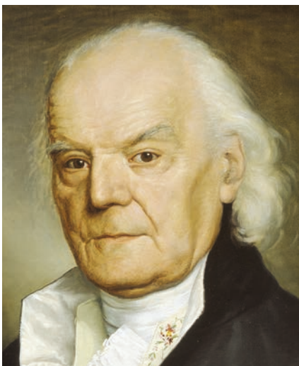
GIOCONDO ALBERTOLLI Ritratto opera di Carlo Gerosa, 1837 ca. (Accademia di Belle Arti, Milano)

L'Archivio di Stato del Cantone Ticino ha il piacere di invitarvi alla presentazione del volume