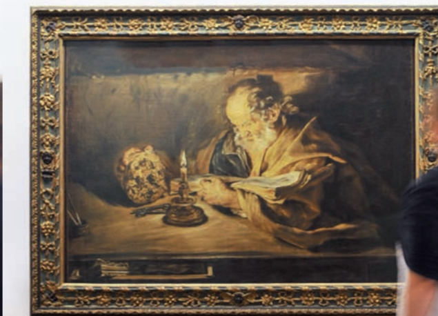
Giovanni Serodine, San Pietro in meditazione

■ Forte di una ricca collezione permanente esposta a rotazione, la Pinacoteca Züst rappresenta oggi nel Canton Ticino il principale polo di studio per l'arte antica, dal Rinascimento al XIX secolo. Negli spazi suggestivi della ex casa parrocchiale, rinnovata e ampliata dall'architetto Tita Carloni (1967) e ristrutturata dall'architetto Claudio Cavadini (1990), si possono ammirare dipinti dei principali artisti di area lombarda e ticinese dal XVII al XIX secolo: Giovanni Serodine, Giuseppe Antonio Petrini, Antonio Rinaldi, Luigi Rossi, Adolfo Feragutti Visconti, Gioachimo Galbusera e molti altri. Si organizzano due mostre temporanee all'anno, sempre curate da personalità di spicco del mondo dell'arte.