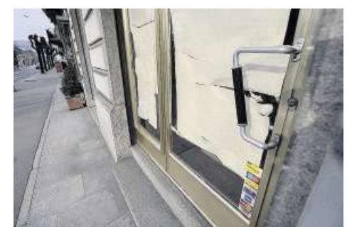
Negozi chiusi in centro Lugano.