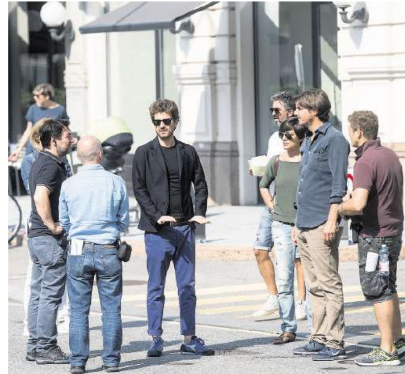
Nel 2016 Alessandro Siani gira a Lugano.

BELLINZONA. Dalla piattaforma per stimolare il "cineturismo" alla voglia di apparire nei film girati in Ticino.