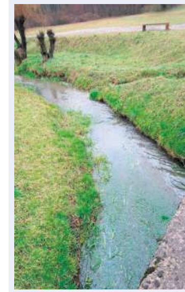
Il tratto di Laveggio interessato.

STABIO. Accertamenti in corso sul tratto del fiume Laveggio interessato da un inquinamento da idrocarburi nella giornata di domenica. I pompieri di Mendrisio, intervenuti sul posto, hanno isolato l'area con degli sbarramenti per contenere le perdite degli oli che, a quanto risulta, proverrebbero da un tratto di strada sterrata nei pressi di uno stabilimento industriale. La pioggia di domenica avrebbe fatto confluire nel fiume la sostanza, la cui origine resta da accertare.